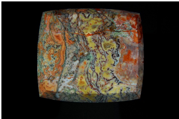
85mm großer Jaspis aus Pfeffelbach im Spitzantikschnitt.

Eindruck eines kunstvoll gefertigten Gemäldes. Besitzen die Jaspisse jedoch eine ornamentale und somit kontinuierliche, sich wiederholende Struktur – als Beispiel diene hier der Jaspis aus Pfeffelbach - wirken diese in rechteckigen Formen wie Badezimmerkeramik. Die Spannung, die durch die spitzantike Form erreicht wird, kompensiert diesen nachteiligen Effekt.