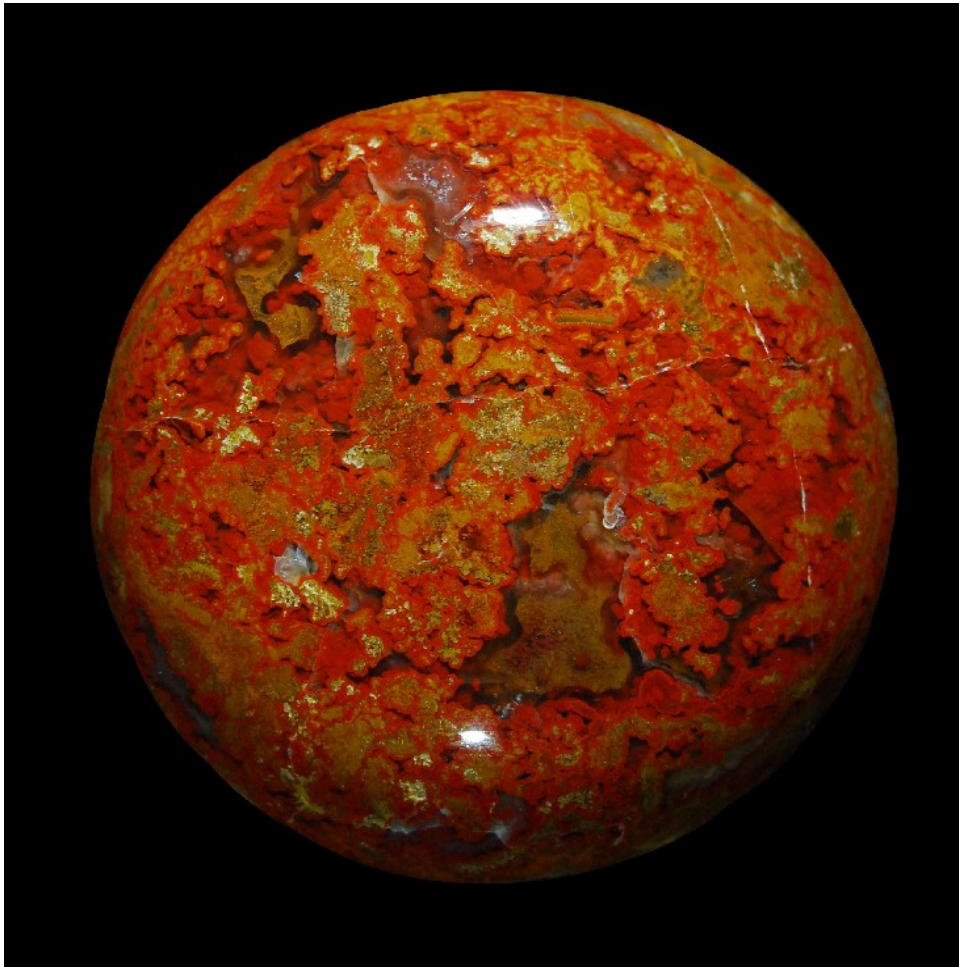
Jaspis-Cabochon aus Eckersweiler, 53mm Durchmesser.

gedrehten Ansichten betrachten und erhält eine Vielzahl von Impressionen.