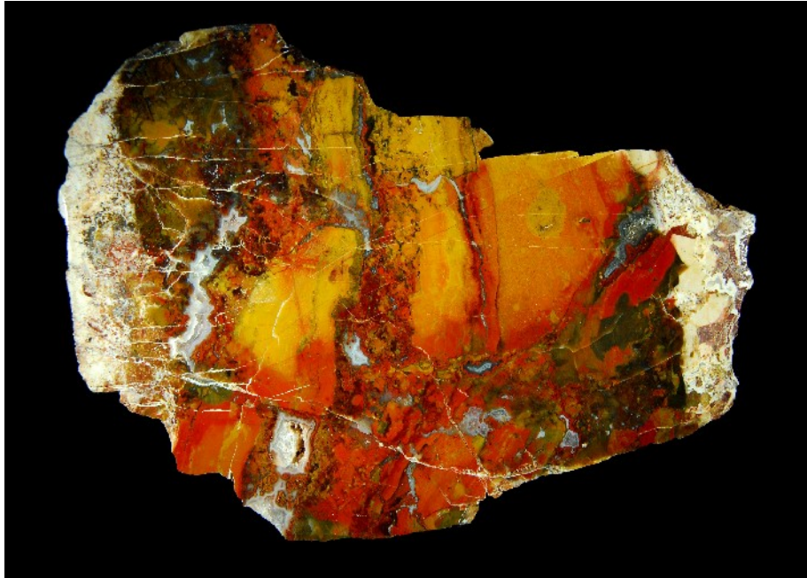
Der Eindruck des Bruchstückhaften ist das große Manko dieses wundervoll gefärbten Jaspisses vom Flugfeld Göttschied

bruchstückhaftes. Üppige Bilder wuchern über den Rand des nicht konturierten Steines hinaus – das Auge findet keinen Halt. Dem Jaspis fehlt das blickführende Element der Bänderung beim Achat, das den Blick immer wieder einfängt und zum Zentrum des Steines leitet.