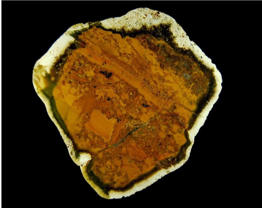
Ein mehrfarbig durch Verwitterung getönter Jaspis aus Arenrath. Durchmesser etwa 100mm.

erhält man eine kurvige Umrißform, nicht selten ein Oval. Diese Steine besitzen zudem eine konzentrische Abfolge verschieden getönter Zonen in das Innere – der Blick wird gelenkt und verhart auf dem Stein.