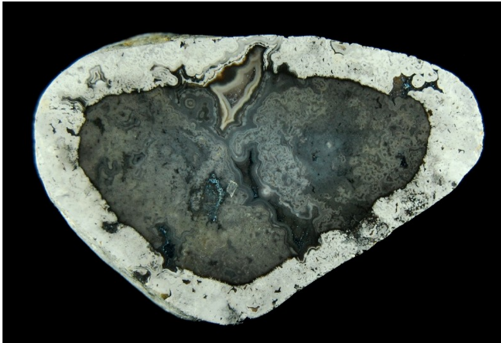
Farbtöne die durch Verwitterung (weiß) und Sulfidisierung (schwarz) an einem Jaspis aus Arenrath entstehen können. (Größe 56mm)

typischen schwefeligen Geruch, den dieses Material beim Schleifen abgibt). Danach können wieder Posen der Wegführung von Pigmenten und Verwitterung der Schale folgen.