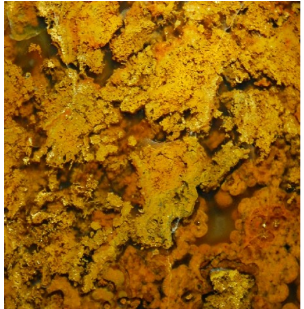
Ähnlichkeiten mit einem Stück aus Eckersweiler (rechts) zeigt dieser Jaspis (links).