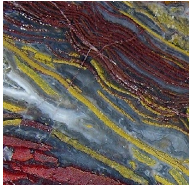
Dieses Stück (links) zeigt eine zerlegte Bänderung der Eisenpigmente ähnlich seinem Pendant aus dem Steinbruch Langenthal (rechts).