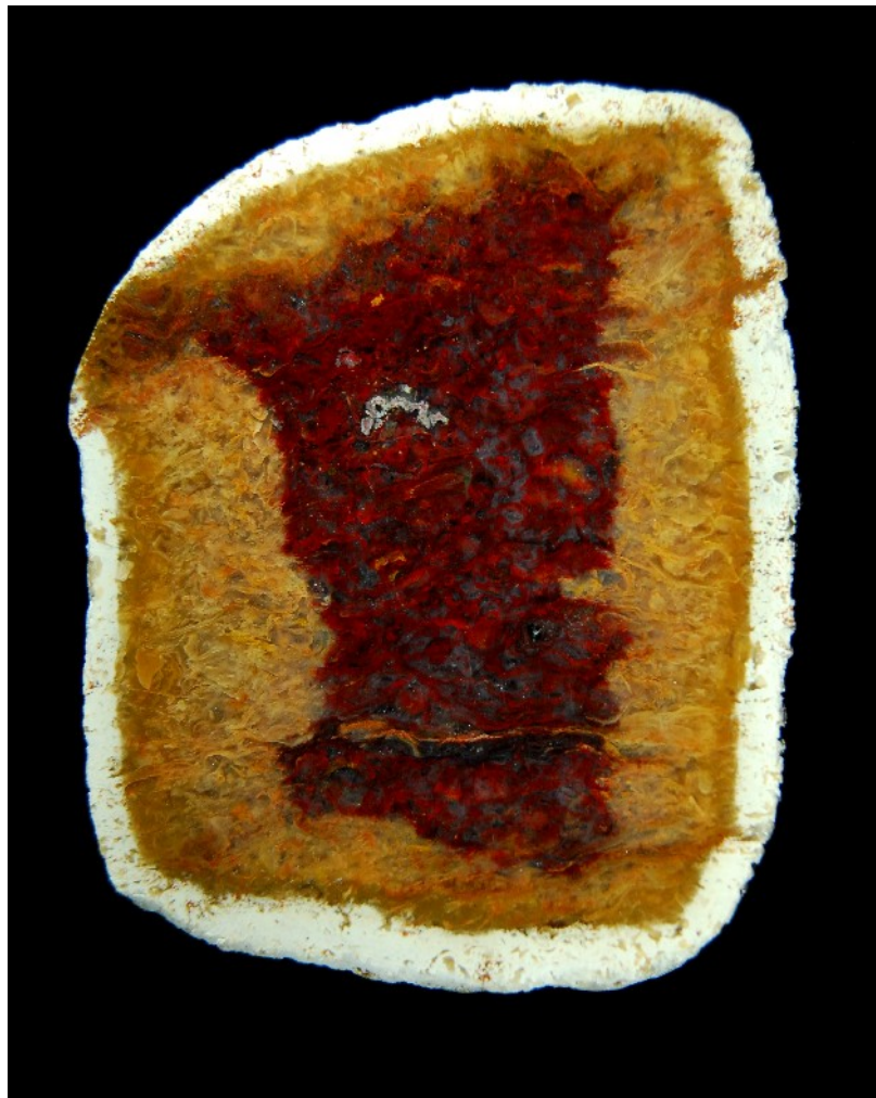
Dreigefärbtes Jaspis-Gerölle aus Arenrath

Juwelen aus längst vergangenen Zeiten. Welchen Einflüssen dieses Material im Laufe der Zeit unterlag macht sich an zwei Besonderheiten dieser Jaspisse fest: sie sind zum Einen abgerollt, was eine runde, ovale, oft kurvige Form des Anschnittes einer solchen Knolle bewirkt, und sie wurden zum Zweiten durch Verwitterung entfärbt, was den Steinen ein gefälliges Bild konzentrischer Bereiche gibt.